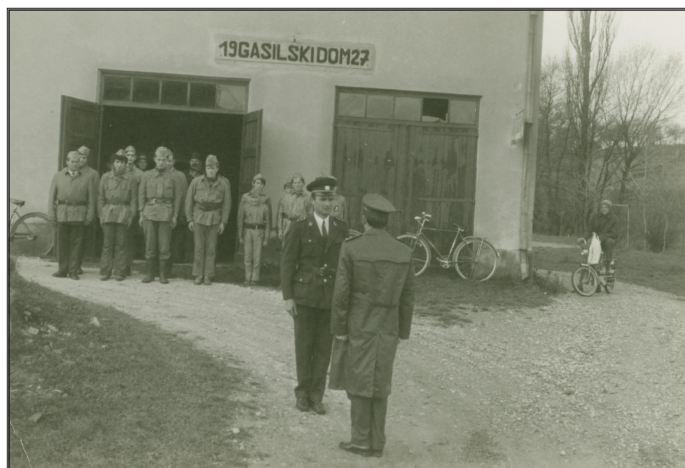
Ocenjevaje društva leta 1971

Vsako leto so v tednu požarne varnosti vodilni Občinske gasilske zveze Brežice opravili preglede društev. Ocenjevali so administrativno delo, pregledali orodje in prisostvovali pri izvedbi praktične vaje.