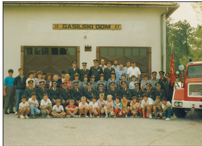
Članstvo društva ob 60 - letnici

9. avgusta 1987 je bilo Občinsko tekmovanje vseh gasilskih enot v Globokem. Mladinska ekipa Globoko je dosegla prvo mesto. Tega dne je bila tudi proslava ob 60 – letnici delovanja gasilskega društva Globoko. Pokrovitelj prireditve je bila DO SALONIT ANHOVO, Opekarna Rudnik Globoko. Ob tem prazniku so bila vsem članom društva podeljena društvena odlikovanja. Odlikovanja so prejela tudi vsa društva, ki so takrat imela center v Globokem.