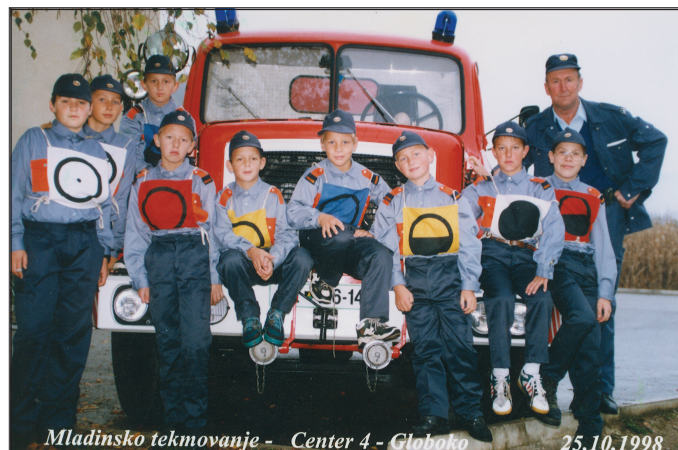
Mladinsko tekmovanje - Center 4 - Globoko 25.10.1998