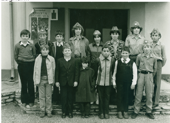
Desetina mladincev in pionirjev ustanovljena leta 1982