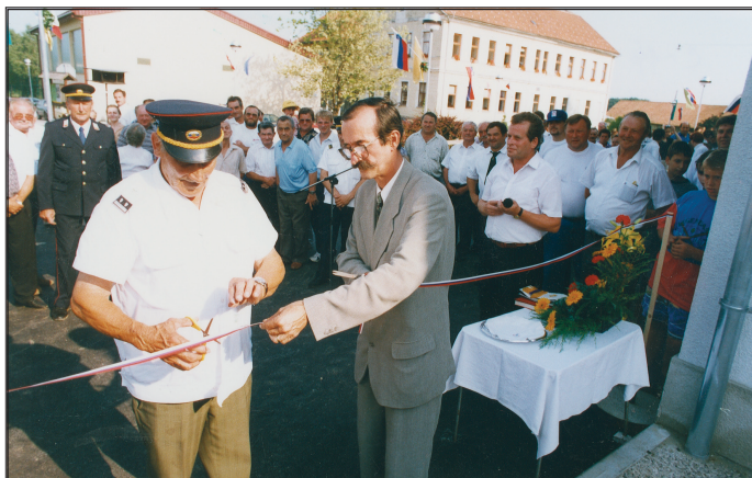
Podelitev plakete društvu s strani predsednika GZ Brežice