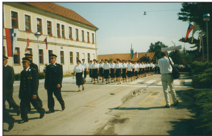
Mimohod ešalona članic