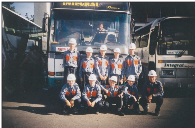
Pionirji in mladinci z mentorji v Kočevju

Mladinska ekipa se je udeležila 27. maja 2000 državnega tekmovanja mladinskih in pionirskih ekip v Kočevju. Rezultat ni bil ravno blesteč, smo pa lahko ponosni, da so se uvrstili na državno tekmovanje. Za uvrstitev na državno tekmovanje je društvo mladincem nabavilo gasilske uniforme, gasilske čelade, pasove in delovne kombinezone.