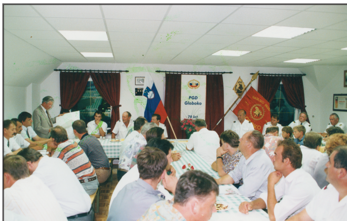
Udeleženci slavnostne seje društva 5. julij 1997