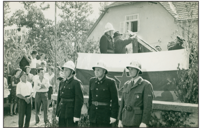
Praznovanje 40- letnice društva in razvitje društvenega prapora