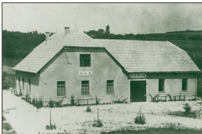
3 Gasilski dom leta 1938/1939

Takoj spomladi leta 1938 so pričeli z izgradnjo skupne stavbe. Dela so potekala nemoteno in brez presledkov, ter bila v celoti končana jeseni 1939. Dom je bil dolg 14 metrov in širok 8 metrov. Vse prevoze za navoz gradbenega materiala so opravili občani brezplačno s konjsko in volovsko vprego na lesenih vozovih, po slabih makadamskih cestah. O avtomobilih še sanjali niso.