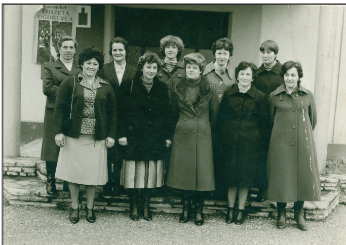
Prva desetina članic ustanovljena leta 1982