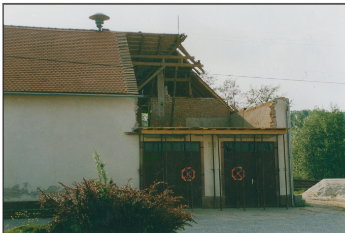
Pričetek del na obnovi doma leta 1996