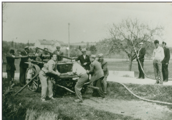
Vaja na ročni brizgalni