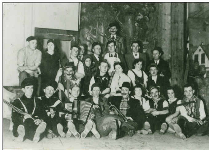
Z igro Divji lovec je gasilsko društvo nastopalo po vseh večjih krajih – leto 1947