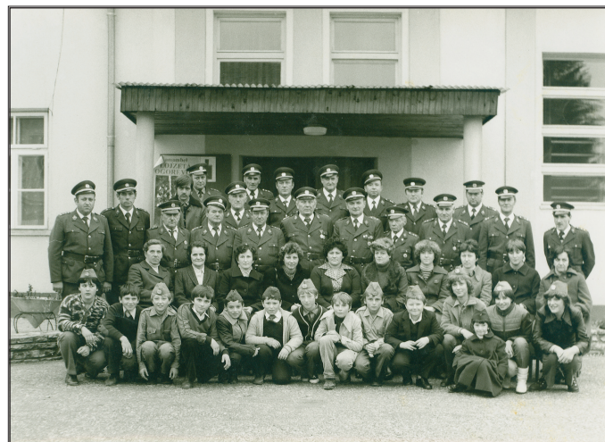
Skupinska slika leta 1982

V tem letu je društvo praznovalo 55 - letnico delovanja. Ob tem je bila posneta »ta prava gasilska slika«