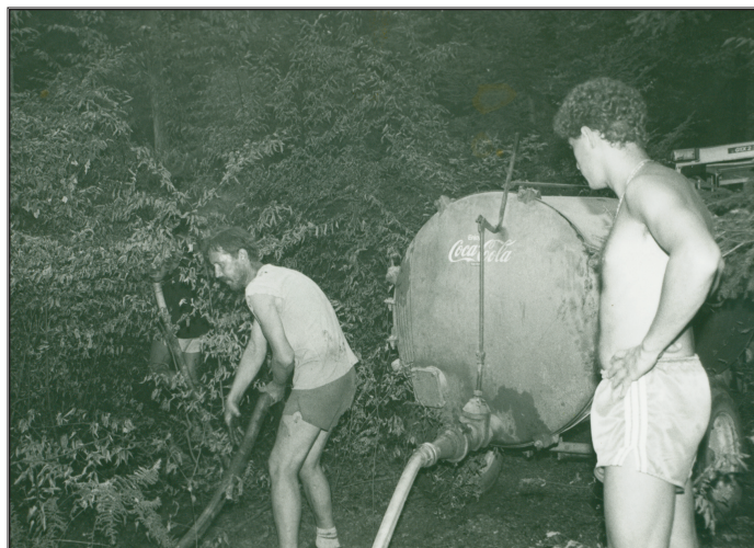
Gašenje požara v Dobravi

Tudi v letu 1993 se nadaljuje sušno obdobje, ki zahteva prevoze vode v odročne kraje. A smola, konec julija 1993 se je pokvarila avtocična. 5. avgusta istega leta je v gozdu Dobrava izbruhnil požar, ki je zajel okoli 6 hektarov gozda in podrasti in traja več dni. Pri tej akciji se je pokvaril še orodni avto, zato se je gašenje ob pomoči krajanov nadaljevalo s traktorskimi cisternami.