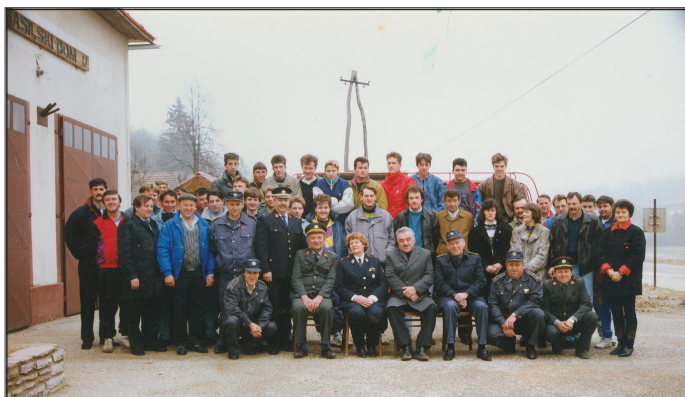
Tečaj za izprašane gasilce leta 1993

V mesecu januarju 1993 je bil v Globokem zopet organiziran tečaj za izprašane gasilce.