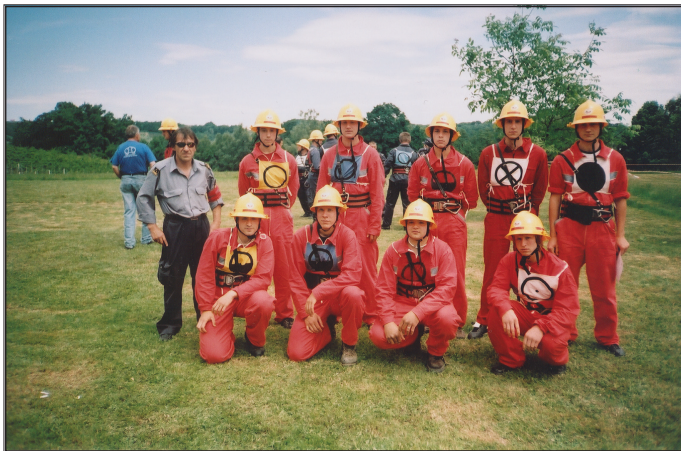
Občinsko tekmovanje leta 2007