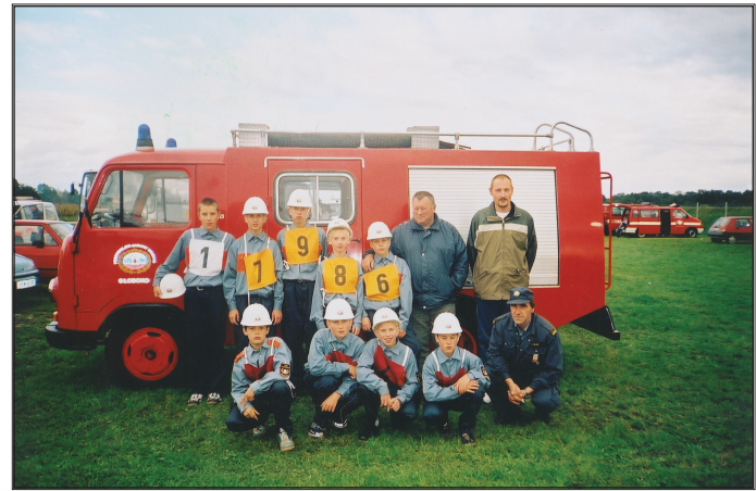
Predizbor za olimpijado