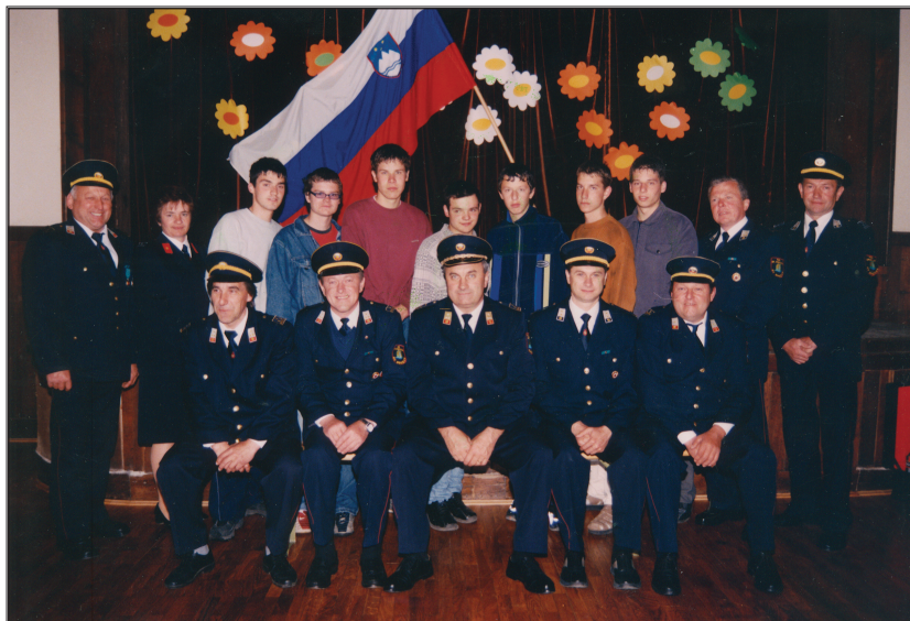
Tečajniki s predavatelji

PGD Globoko ima nekako nalogo, da organizira v okviru IV. Sektorja tečaje za izprašane gasilce. Osem članov in članic društva je tečaj uspešno zaključilo januarja 2001. V letu 2004 je izobraževanje za gasilca končalo 11 članov in članic našega društva.