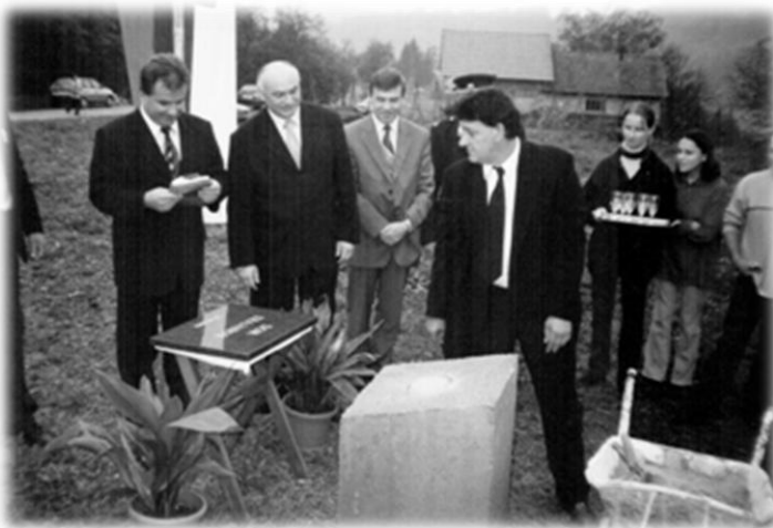
Slika 7: Polaganje temeljnega kamna