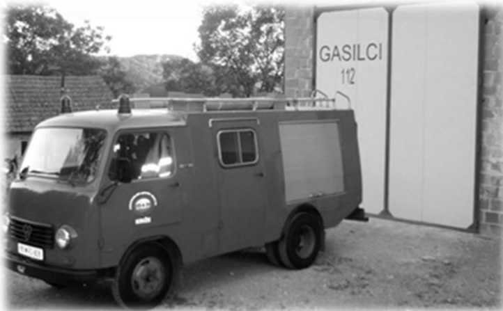
Slika 16: Kupljeno vozilo