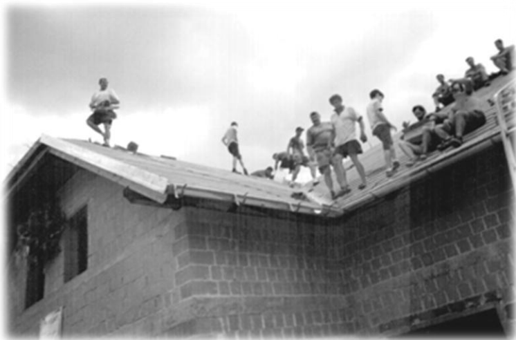
Slika 10: Dela na ostrešju

Vsak dan je bilo na gradbišču prisotnih več članov društva, ki so opravljali vsa potrebna dela. V jesenskem času smo začeli iskati ponudnike za okna in se odločili za podjetje Secom iz Krškega.