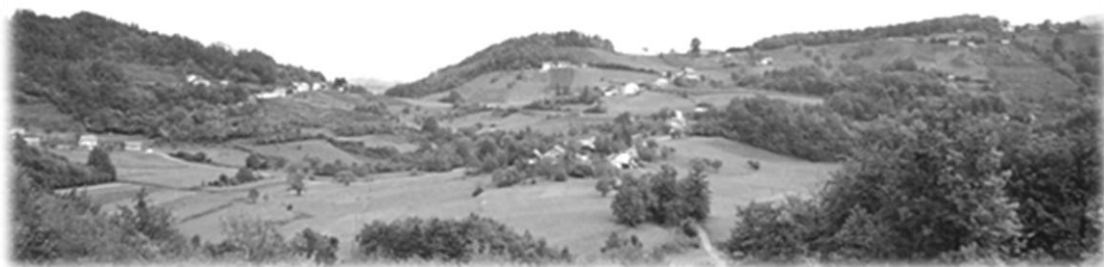
Slika 1: Križe

Prav tako so Križe na kratko opisane v Wikipediji, proste enciklopediji, ki je dostopna na internetu, in sicer se opis glasi: