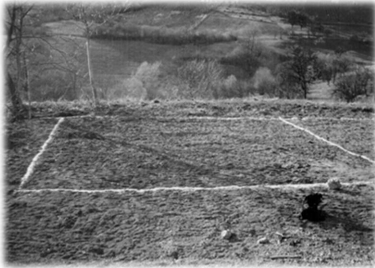
Slika 8: Zarisan prostor za gasilski dom