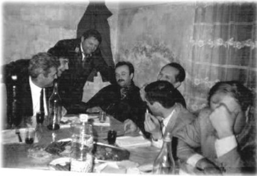
Slika 3: Ustanovni občni zbor