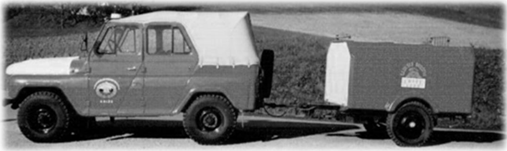
Slika 4: Prvo terensko vozilo in prikolica

Od Gasilske zveze Brežice smo dobili tudi prvo terensko vozilo UAZ in 10 delovnih oblek.