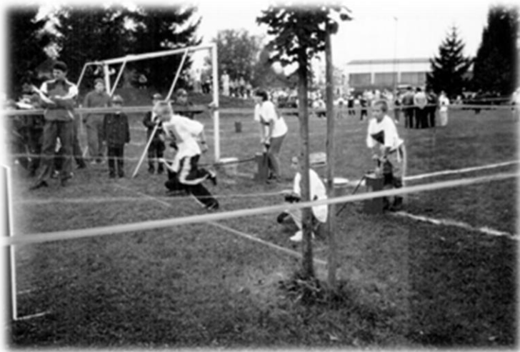
Slika 6: Prvo mladinsko tekmovanje