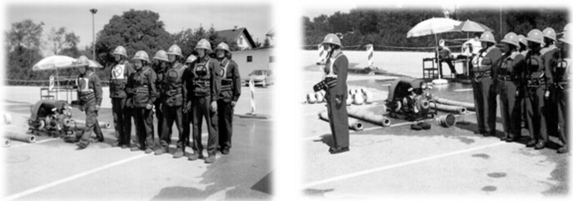
Slika 11: Moška in ženska ekipa pred izvedbo vaje na občinskem tekmovanju v Dobovi

Intervencij v letu 2005 nismo imeli. 11. novembra smo bili obveščeni o požaru na stanovanjski hiši našega člana v Zg. Pohanci.