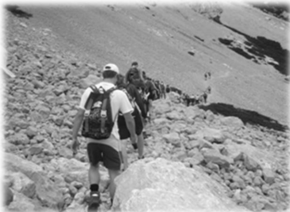
Slika 18: Pohod na Begunjščico

To leto ni bilo v znamenju tekmovanj, a smo se kljub temu na povabilo udeležili tekmovanja za memorial Ernesta Lombarja v Križah pri Trziču, kjer so članice osvojile 2., člani pa 3. mesto. Sodelovali smo tudi na igrah brez meja na Obrežju.