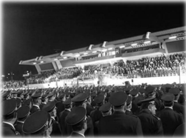
Slika 17: 15. Kongres Gasilske zveze Slovenije

Udeležili smo se tudi raznih svečanih prireditev in proslav, med katerimi je vsekakor najpomembnejši 15. kongres Gasilske zveze Slovenije, ki se je odvijal 24. maja v Krškem. Kongresa se je udeležilo 9 članic in 3 člani. Prav tako smo se odzvali na povabilo PGD Križe pri Trziču in se z 8 člani udeležili Florjanovega, kjer so ob tej priložnosti položili temeljni kamen za gasilski dom. Člani in članice so se udeležili tudi Dneva gasilcev občine Brežice, ki so ga ob 100-letnici organizirali v Pišecah. Sedaj smo se že skoraj tradicionalno podali na izlet na Gorenjsko in sicer na Begunjščico in na Roblek. Prav tako smo tudi letos organizirali martinovanje, na Ožbaltovo pa pripravili srečelov.