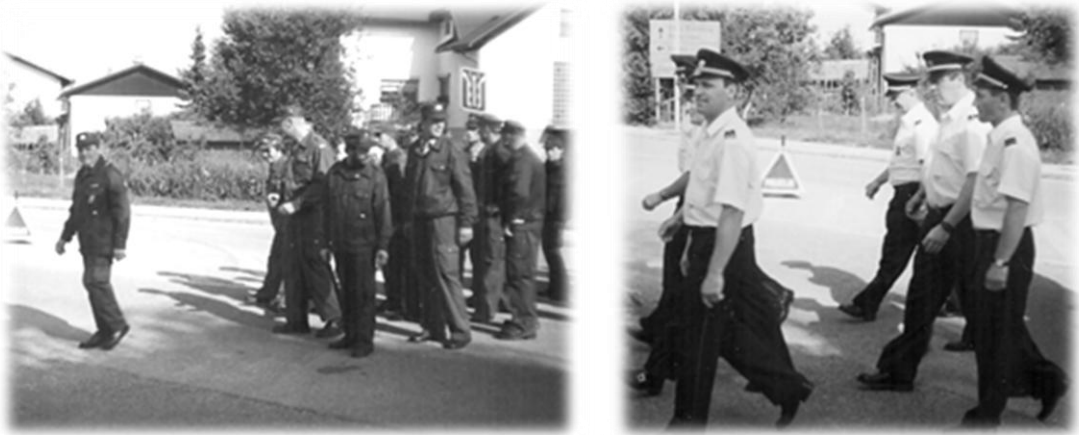
Slika 9: Priprave na parado

Na izobraževalnem področju smo dobili prvih 6 vodij skupine, ki so si pridobili čin gasilec I. stopnje.