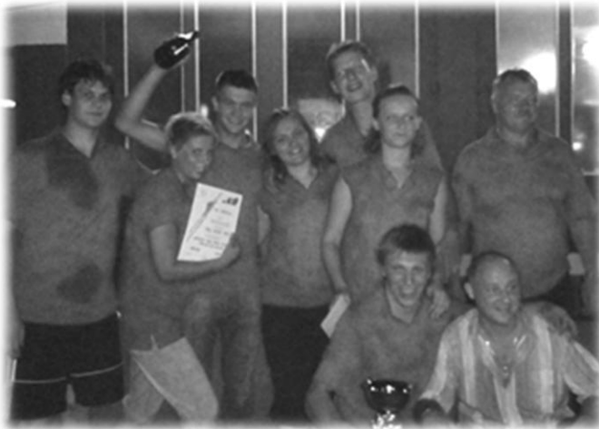
Slika 15: Zmaga na igrah brez meja