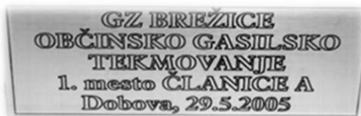
Slika 12: Pokal za 1. mesto na občinskem tekmovanju

Na področju tekmovanj smo bili v letu 2005 zelo uspešni. To leto sta se moška in ženska ekipa udeležili kar nekaj tekmovanj. Moška ekipa je na občinskem tekmovanju dosegla 5. mesto, ženska ekipa pa je zasedla 1. mesto in si tako zagotovila udeležbo na regijskem tekmovanju. Prav tako se je ženska desetina odlično izkazala na regijskem tekmovanju, kjer je dosegla 2. mesto in si tako zagotovila mesto na državnem tekmovanju leta 2006. Ženska ekipa je pokal prinesla tudi iz Križ pri Trziču, kjer so zasedle 3. mesto. Člani društva smo sodelovali tudi na